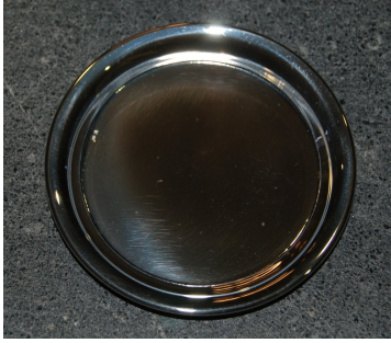
SKL-Derby-voittajalautanen (1947) Derby-voittajalle omaksi.