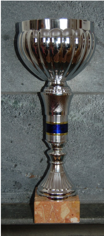
110-juhlavuoden pokaali (2011)