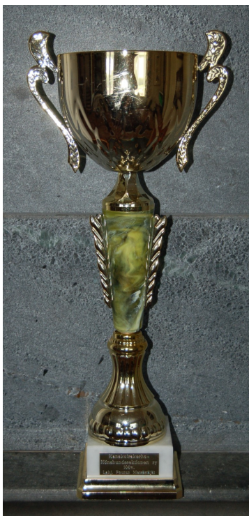
Poutun pokaali (2001)