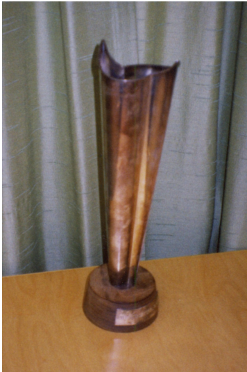
Derby-pokaali (SKL 1947) Kiertopalkinto Derby-voittajalle.