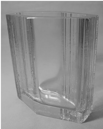
Ragnarin malja (R.Kreuger 1963) Kiertopalkinto Derby-kilpailun toiseksi parhaalle koiralle sukupuoleen ja rotuun katsomatta. Kolmesta poikki.