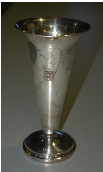
NPK-pokaali Kiertopalkinto Derby-voittajalle.