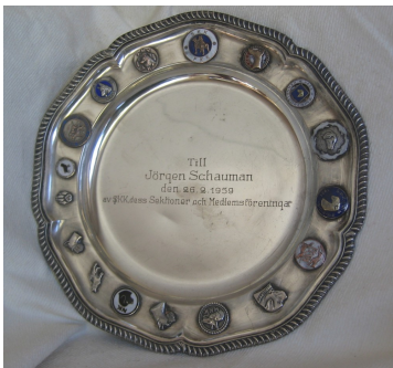
Derby-kasvattjalautanen Kiertopalkinto Derby-voittajan kasvattajalle.